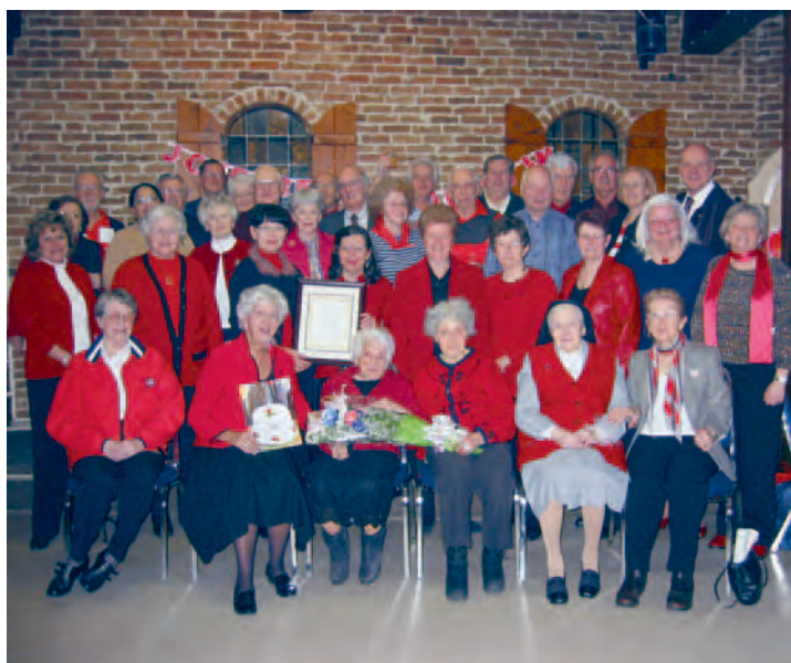
Photo de groupe qui montre bien que le rouge de la Saint-Valentin est à l'honneur